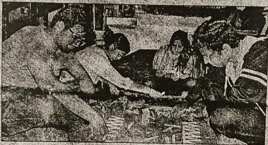
एचबीटीआई में टेकफेस्ट के दौरान ब्रिज मेकिंग प्रतियोगिता में भाग लते छात्र-छात्राएँ।