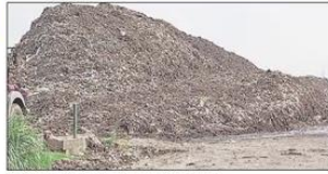
पनकी के भव सिंह में प्रदूषण फैला रहा कूड़े का पहाड़।

कानपुर। पनकी के भव सिंह में कूड़े के पहाड़ से निकलने वाली सीधे नैस से आसपास के लोगों का रहना मुश्किल हो गया है। वहाँ, कूड़े के पहाड़ से निकल रहा सीधे जल के नीचे जा रहा है। यह सीधे पनकी की प्रभावित करने के साथ ही चार किमी तक पेरनाम को भी दुर्घट कर रहा है। यह खुलासा हुआ है पीएसआईटी, पचवीटीयू व आस्ट्रेलिया के वैज्ञानिकों की रिसर्च में। रिसर्च में पता चला कि लीचेट