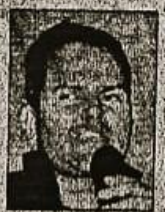
एचबीटीआई में आरजे पूरब।

कानपुर एचबीटीआई के सिविल विभाग का वार्षिक टेकनो कल्चरल फेस्ट 'निर्माण-2016' शनिवार से शुरू हो गया। फेस्ट के पहले दिन छात्रों ने तकनीकी प्लान व खेला के बीच अपनी प्रतिभा दिखाई। पहले दिन टेक्सटिंग, स्पेल बी, आरजे हट, प्रेपर ड्रास, लोगो डिजाइन, रोडीज व लैन गेमिंग प्रतियोगिताओं का आयोजन किया गया। इनके अलावा फेस्ट में छात्रों के लिए