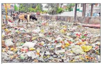
शारदा नगर ग्रीन वेली में कूड़े का लगा अंबार।