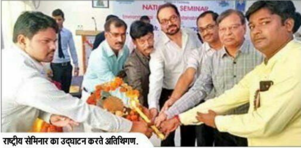
राष्ट्रीय सेमिनार का उद्घाटन करते अतिथिगण.